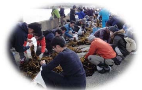
ワカメ収穫の様子