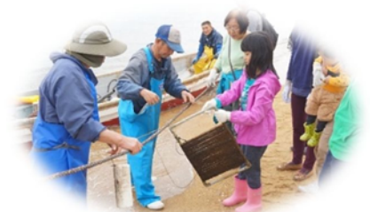
幼芽巻付けの様子